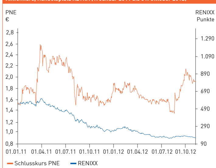
Aktienkurs, Handelsplatz XETRA (1. Januar 2011 bis 31. Oktober 2012)